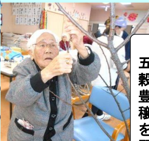
五穀豊穡を願って