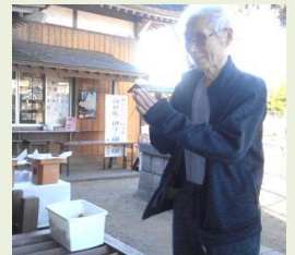
いい一年になりますように！