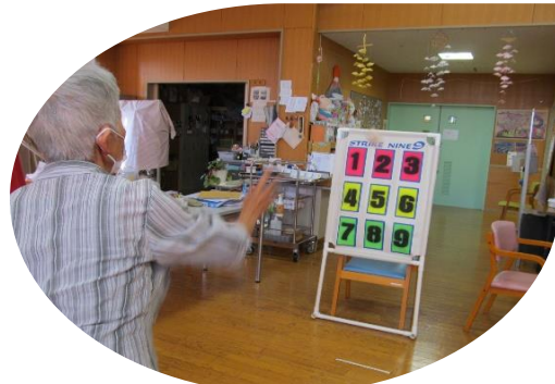
ストライクアウト