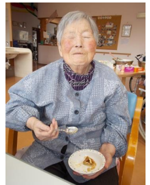
お好み焼きを作り、食べて頂きました