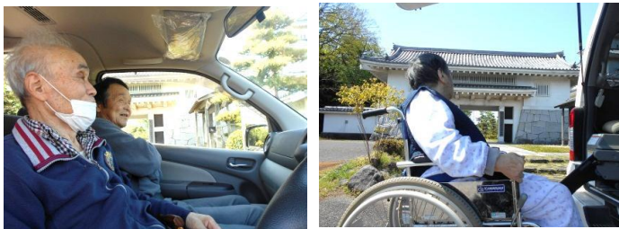
かすみがうら資料館