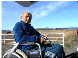
高浜より筑波山展望