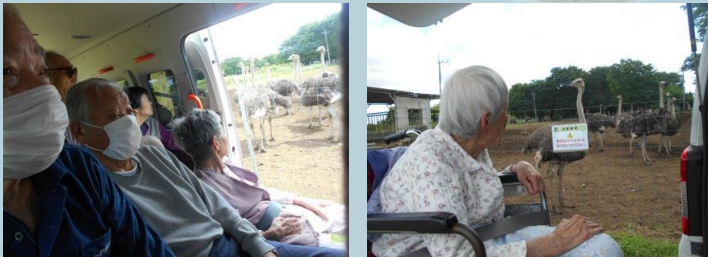
ダチョウ王国に行ってきました。