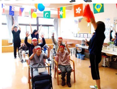
力を合わせてエイエイ