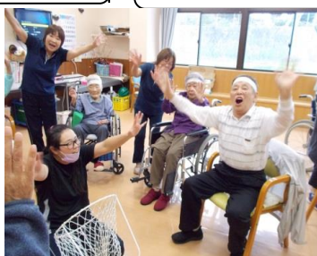
玉入れは白組の勝利！