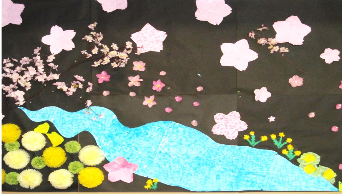
壁一面に春の桜や菜の花、たんぽぽを表現しました。