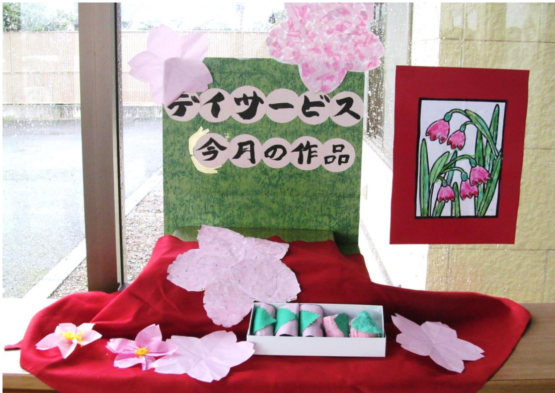
玄関には、さくらの花びらと美味しそうな桜餅を飾りました。